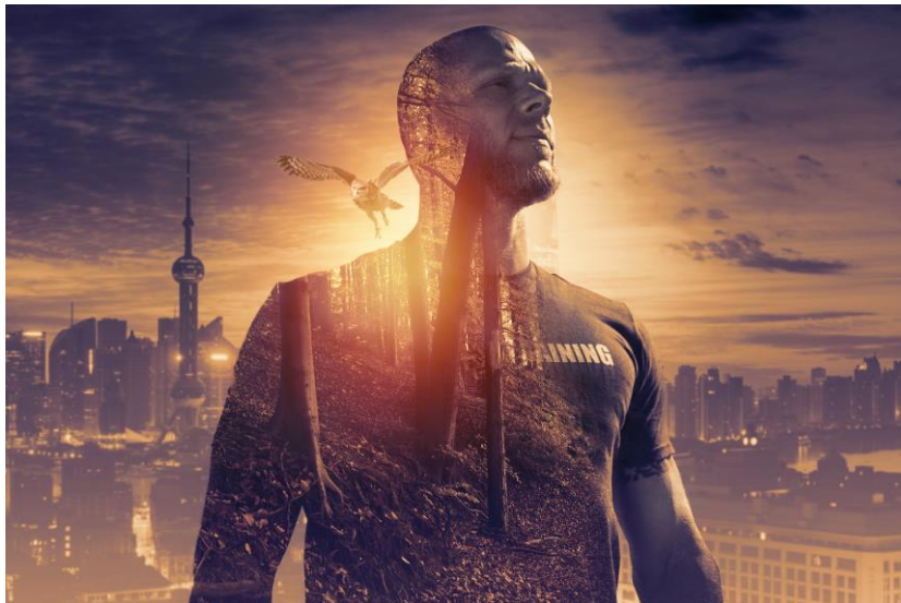
Immagine Perfetta e come crearla

MasterClass Professionale. Ingegneria dell'AudioVisivo per Il Cinema la Televisione e il nuovo Mondo Mediatico.